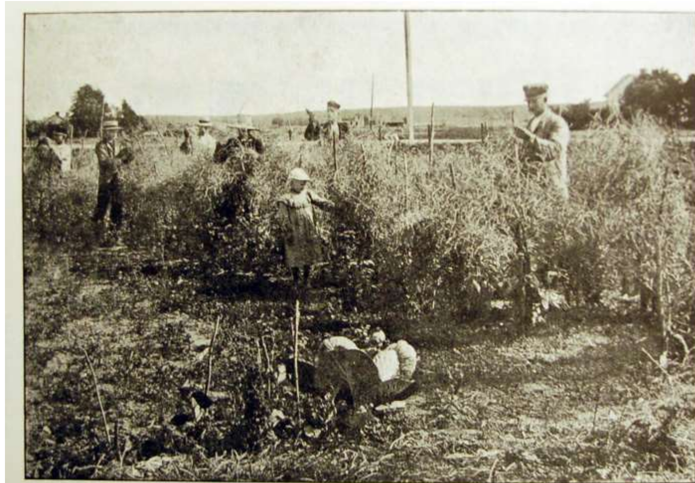
Fröodling af Safstaholms Hvitkål.